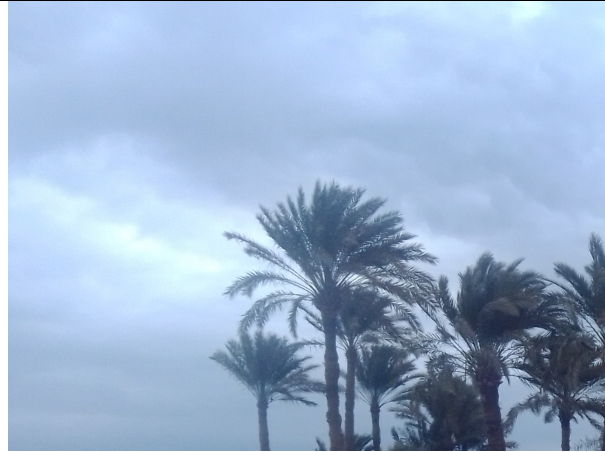
Im Niltal – schroffer Übergang zwischen Flussoase und Wüste

– uralte Zivilisation und Moderne im schmalen grünen Band am Nil