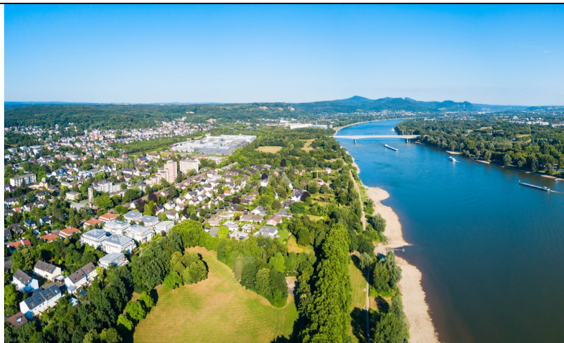
Bonn – vom Regierungssitz zur Dienstleistungsstadt Beuel, Siebengebirge und die Rheinaue

Nachwirkungen zahlreicher politischer Brüche in Stadtbild und Stadtgesellschaft