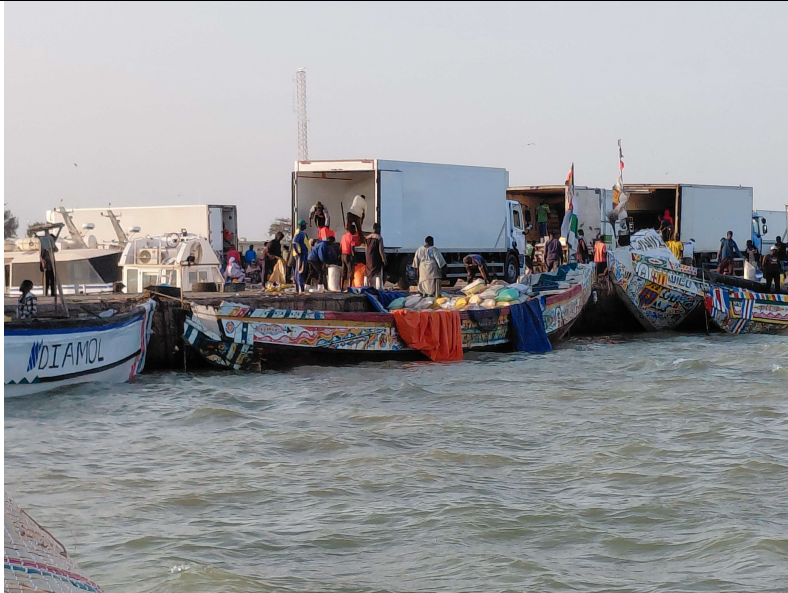
Anlanden und Weitertransport von Fisch im Hafen von St. Louis

2.-17. Januar 2027 Studienreise in den Senegal