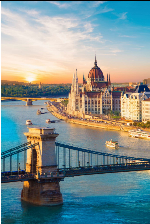
Budapest – Buda auf einem Höhenzug und Pest in der weiten Tiefebene auf der anderen Donauseite