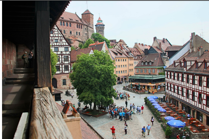
Nürnberg – im Schatten der Kaiserburg: NS-Inszenierung und Versuch der Verbrechen aufarbeitung