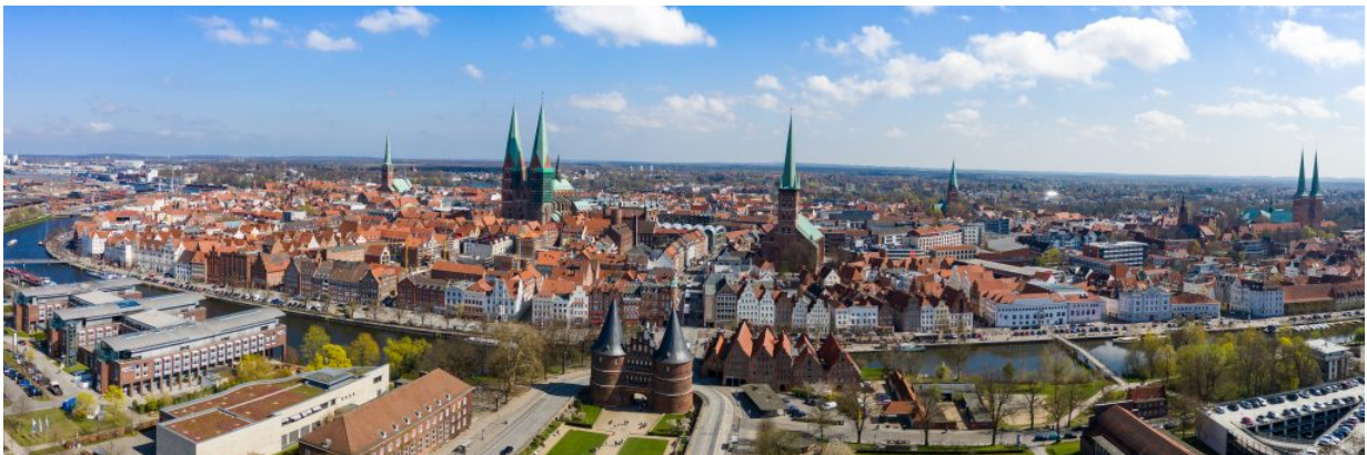
Mittelalter und Zukunft – Lübeck im Panoramablick

31.08.-04.09.2026 Studienreise/Seminar zur politischen Bildung