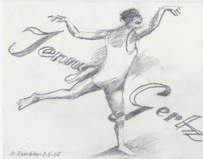
Zeichnung Meinhard Raschke

Feierliche Übergabe eines Stolpersteins für die Tanzpädagogin Jenny Gertz (1891-1966) am Literaturhaus Hamburg, Schwanenwik 38. Bringt Blumen zum Ablegen mit! Kulturverein Olmo e.V., in Zusammenarbeit mit NaturFreun- den, Comm e.V. u.A.