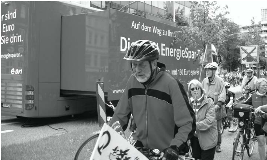
e-on - fit fürs Klima! - so schön kann Demagogie sein

Zur Fahrradsternfahrt kamen ca. 18 000 Teilnehmer, nicht wie zunächst geschätzt 10 000. Mitglieder der Friedensbewegung bildeten den so genannten Friedensstrahl, der mit 20 bis 30 Teilnehmern eher gemütlich war. An mehreren Orten der Fahrtstrecke wurde auf den Zusammenhang von Mobilität und Militär hingewiesen. Z.B. vor der Führungsakademie der Bundeswehr in Blankenese oder vor dem Tamm-Museum in der Hafencity. http://wandsbek.org/pages/posts/nochmal_zur_fahradsternfahrt313.php?searchresult=1&sstring=Fahradsternfahrt