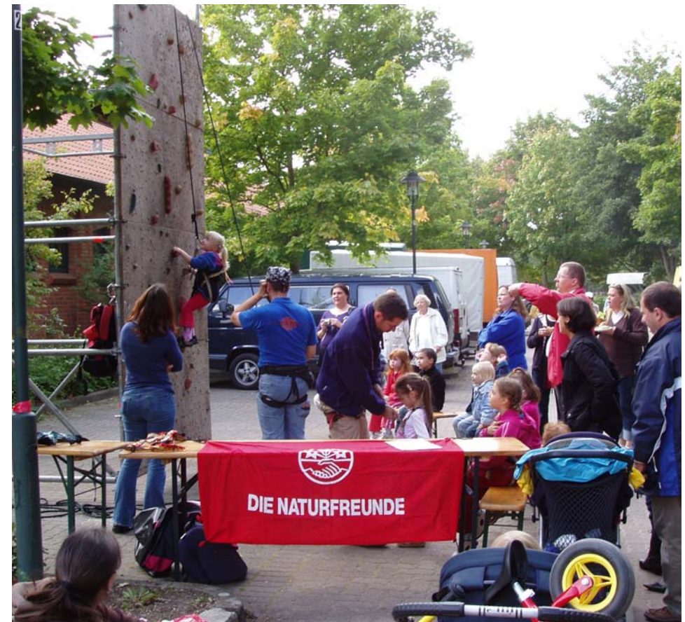
NaturFreunde Kletterwand auf dem Apfelfest 2008, Foto: Udo Schuldt

Allen, die anderweitig beim Wandern oder Klettern unterwegs sind, wünsche ich eine schöne und unfallfreie Urlaubszeit.